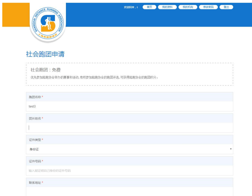
图 2-3 申请社会跑团会员