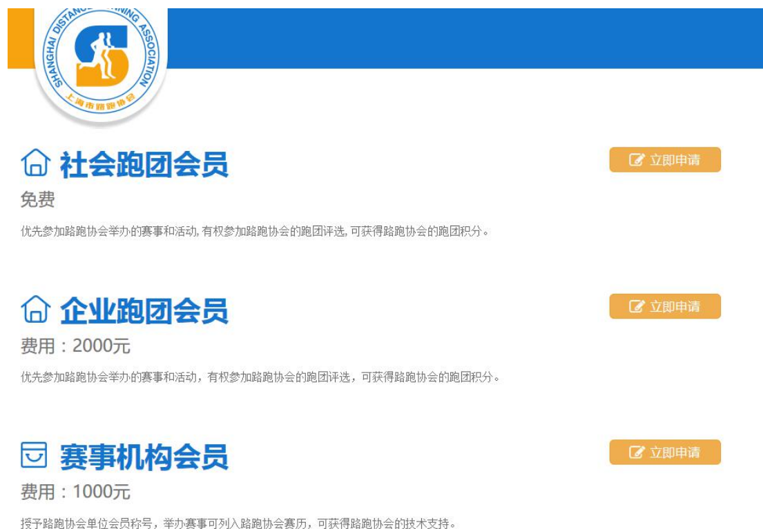
图 2-2 机构会员申请

进入机构会员申请界面后，如图 2-2 所示，根据需求选择相应的类型并点击立即申请，申请相关的机构会员。