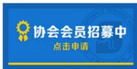
图 1-1 首页申请协会会员

在上海市路跑协会官网（ http://www.sdra.org.cn ）首页，点击协会会员招募中，如图 1-1 所示：