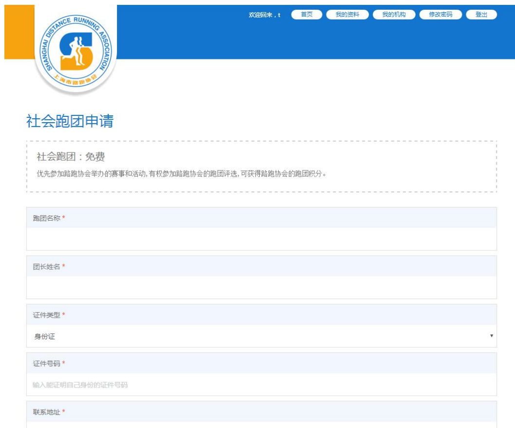
图 4-1 创建跑团表单

之后在我的机构中，可以查看到新创建的跑团，待审核通过后，即可进入新建的跑团，并管理跑团。