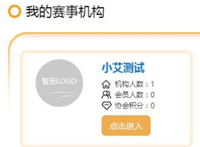
图 3-1 我的赛事机构