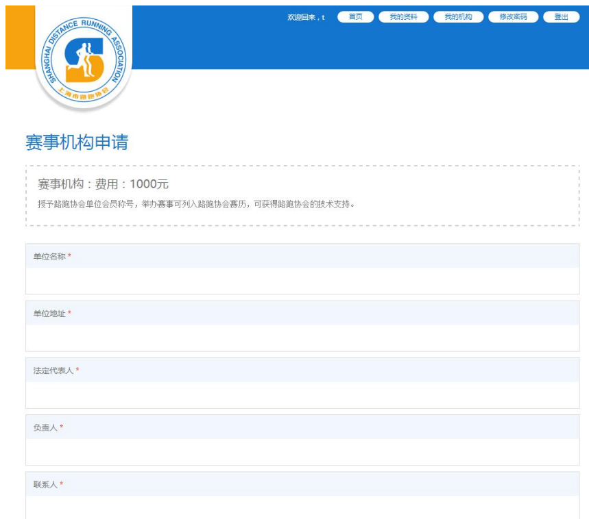
图 2-5 机构会员申请