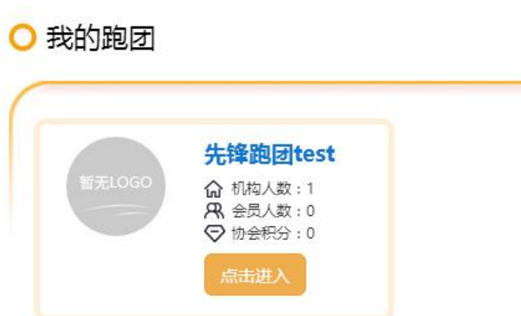
图 4-2 我的跑团列表

之后在我的机构中，可以查看到新创建的跑团，待审核通过后，即可进入新建的跑团，并管理跑团。